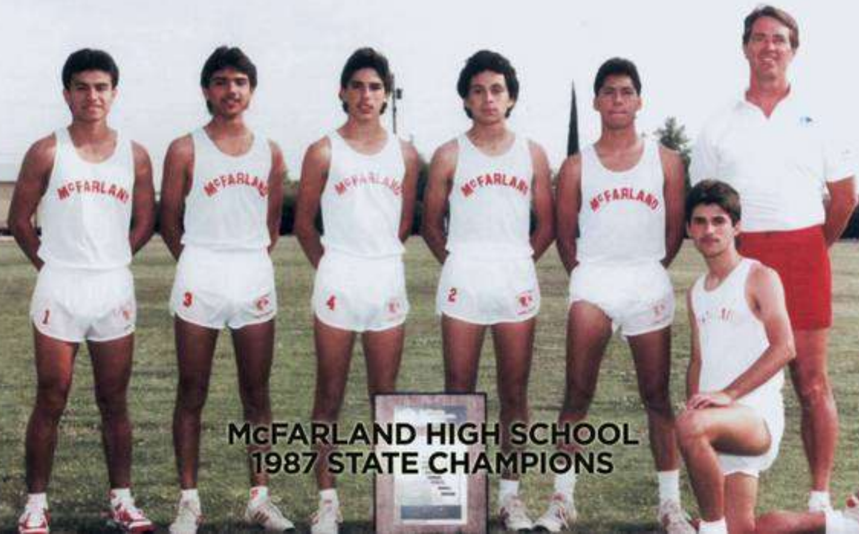
MCFARLAND HIGH SCHOOL 1987 STATE CHAMPIONS