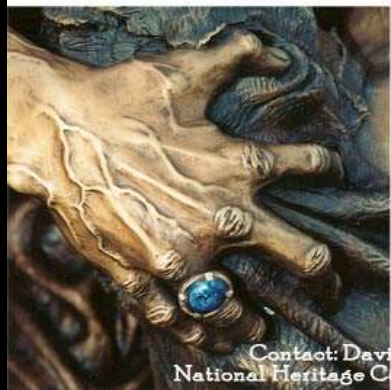
"The Prodigal Son"

Contact: David L. Spellerberg, Founder National Heritage Collectors Society (818) 991-0953